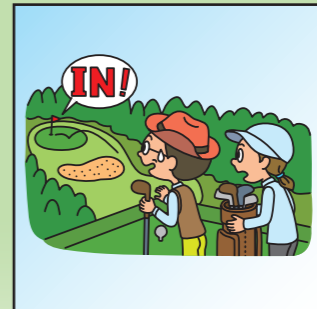
ホールインワンを達成して 祝賀会等の費用を負担した。