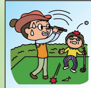
ゴルフ中に同伴者にケガを させてしまった。