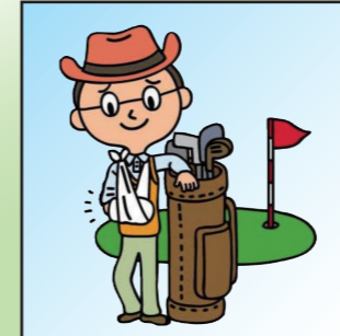
ゴルフ中にスイングした拍子に 転んでケガをした。