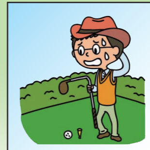
ゴルフクラブが曲損してしまった。