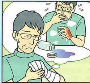
薬品を誤ってこぼして、手に火傷を負った。