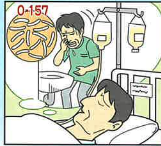
O-157に感染して入院した。