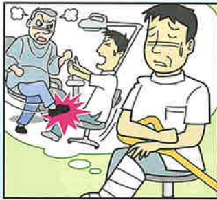
興奮した患者に蹴られて足の骨を折った。