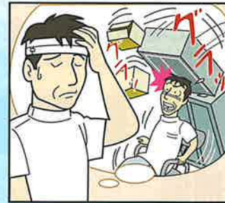
地震によりケガをした。