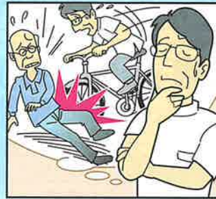
自転車運転中に他人にケガをさせた。