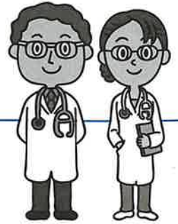
イラスト©東京海上日動

1 24時間、国内、海外、業務上、業務外を問わず、急激かつ偶然な外来の事故によるケガを補償します。